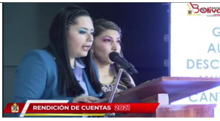
Fotografía 9. Respuesta a la preguntas planteadas por la ciudadanía.