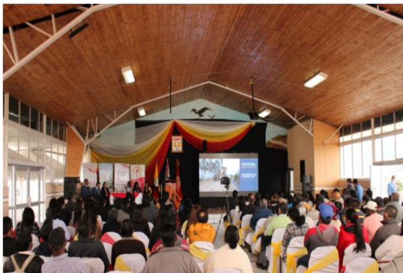
Fotografía 1. Asistentes a la Rendición de Cuentas 2021