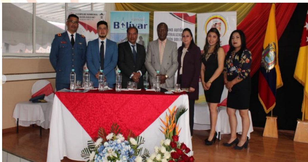
Fotografía 10. Rendición de cuentas 2021.