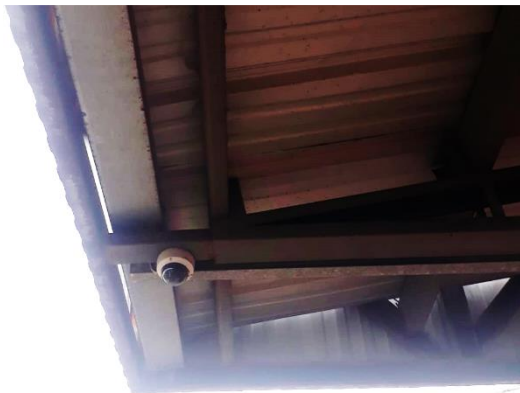
Inversión total: USD 4.259,36

Alumbrado en la sección de frutas, verduras, legumbres y hortalizas del mercado mayorista.